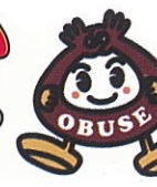
おふせくりちゃん