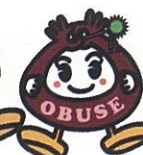
おふせまろんちゃん