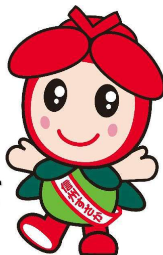
須坂市「花と緑のまちづくり 事業」のマスコットキャラク ターかんなちゃん