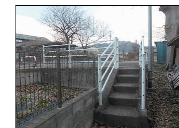
E F 間は歩行者用短絡路があります。

ならびの六角堂 線路をはさんで富士通コンポーネント この辺りは春の桜がみごとです。