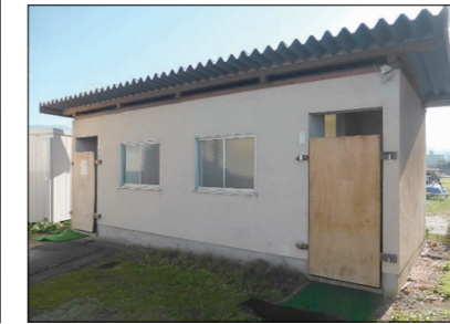
外にトイレがあります。