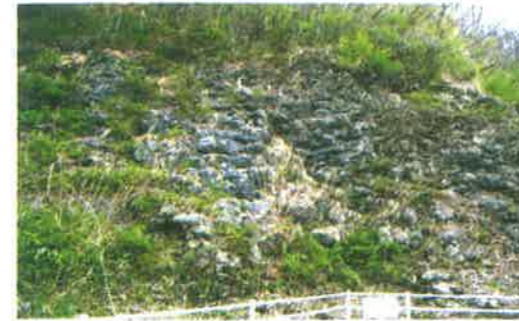
A 井上枕状溶岩 (県天然記念物)

枕状溶岩は俵状溶岩とも言い、枕や俵のような丸みをおびた塊がいくつも重なりあうように見えることから名づけられています。これは、溶岩が水中に流れ急激に冷やされるとこのような形になります。井上の枕状溶岩ができた時代は、今からおよそ2千万年前で、当時この一帯は海で、活発な火山活動があったことがわかります。