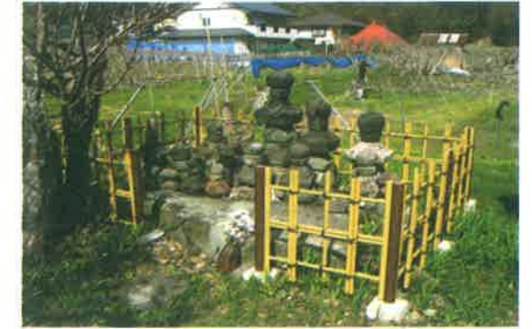
F 井上氏墳墓 (市指定史跡)

井上氏は須坂市井上を本拠地とする中世武士団で、この地方の須田、高梨、村山、仁礼氏の総本家で、清和源氏の一族とされています。源経基の孫頼信(または満仲)の子頼季から井上に住し、その居館跡は県の史跡に指定されている。墳墓は井上氏の誰のものか不明ですが、もともと土栗にあったものをこの場所に移したと伝えられています。