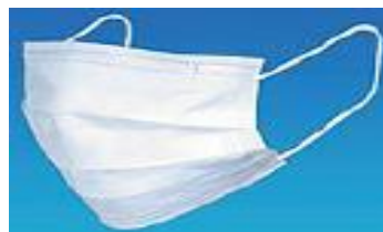
サージカルマスク (プリーツ型)