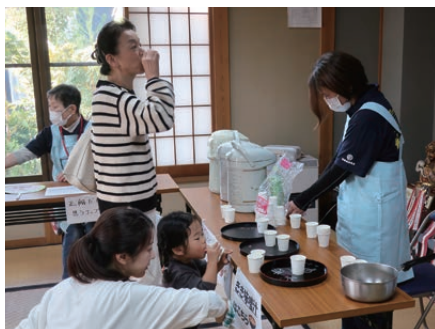
ききみそ汁体験中