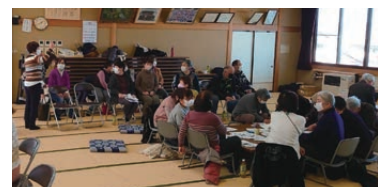
大勢の参加者と一緒に盛り上がりました

※1度高血圧 収縮期血圧 140~159 mmHg 拡張期血圧 90~99 mmHg または (診察室血圧)