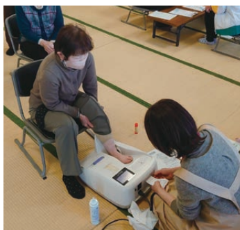
骨密度測定、結果はいかに...

今後とも気軽に参加、交流 できる場としてふれあいサ ロンを継続していきたいと 思います。