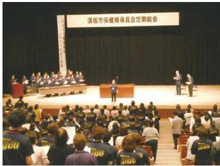
お揃いのポロシャツで会歌斉唱

保健補導員として2年目 となるにあたり、これまで 学んだ多くのことを更に意 欲的に仲間とともに広めて いきたいと、心新たに思わ せて頂いた有意義な総会で した。