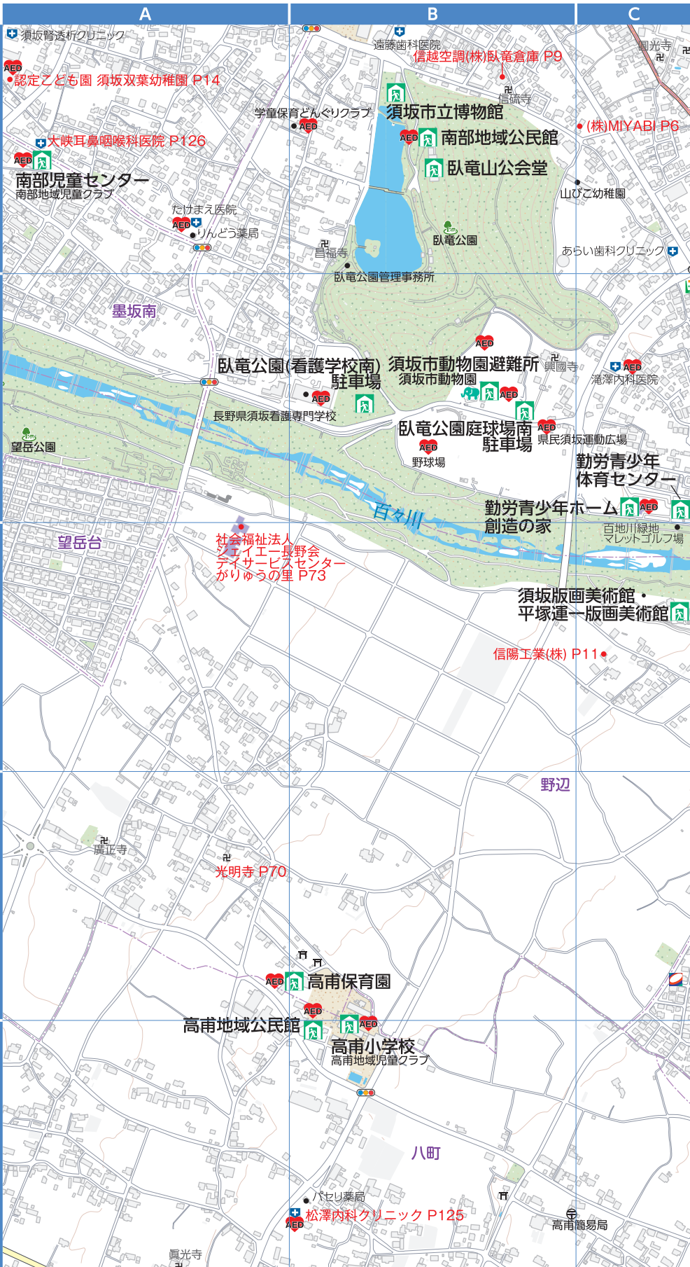
: 指定緊急避難場所および指定避難所、応援協定避難場所