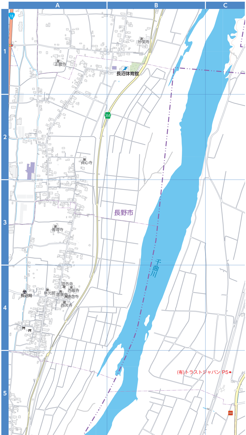
P : 指定緊急避難場所および指定避難所、応援協定避難場所