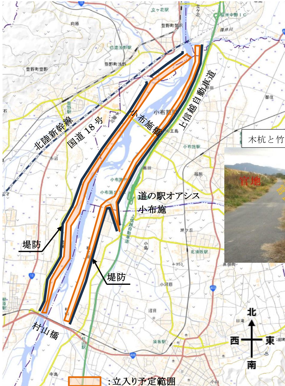
木杭と竹棒の設置イメージ