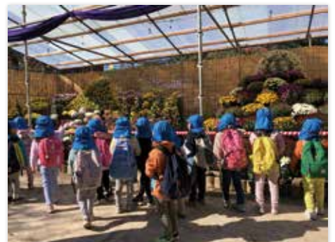
臥竜公園の菊を見学する園児

問 保育園ごとに利用率やコストに大きな差があるが、市はこれを問題と認識しているか。 部長等 定員の見直しや施設の劣化調査を行い、適正な予算執行と格差是正を検討する。 問 市全体の子育て満足度は18%だが、改善策や目標数値はあるか。 部長等 医療費無償化・育休退園の見直しなど来年度から取り組む。満足度の数値目標は設定していない。