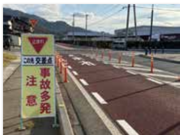
交通事故の多い屋代線跡地道路と幸福ラインの十字路口

問 屋代線跡地道路と交差する市道での車両事故が多く、優先道路と停止義務道路の区分が分かり難い。運転者の心理に即した改善は。 副市長 カラー舗装やゴム製ボールの設置、看板などで注意喚起を進めてきた。事故発生状況を随時警察署に確認し把握に努めている。標識や路面標示の強化・視認性向上等有効な対策が可能か須坂警察署と協議検討する。