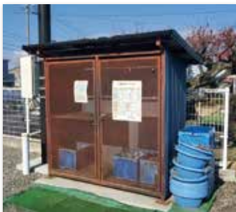
区未加入者からは、ゴミ管理協力費を！

て頂きたい。区未加入者から、ゴミ管理協力費を頂いている区もある。 離婚と養育費 問 本年4月1日から、離婚した時の子供の養育費が、相手からもらいやすくなる『法定養育費制度』が施行される。どのようになるのか。 部長等 離婚協議書や養育費合意書の公正証書が無くても、取り決