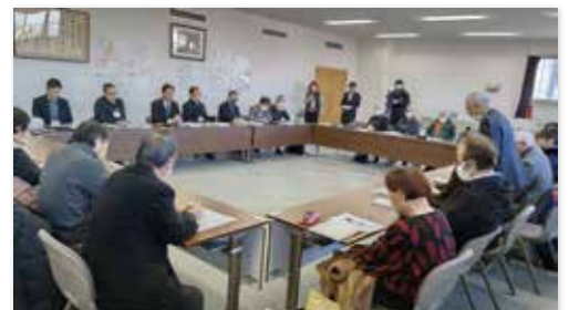
「市民の会」のみなさんが 教育委員会に要請行動

問 聞く耳を持たない 姿勢を改め、豊丘 や高甫地域の皆さん と協議をどうすすめ るのか。 教育長 良く検討し、 方針案に反映させる。 問 出された意見に どう応えるのか、出 かけて行って、ひざ 詰めで協議する絶好 の機会だ。 教育長 反対の方が ほとんどの話し合い が多い。そこには行 けない。