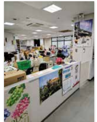
観光交流センターへ移動するシルキービル2階の観光協会跡地に高校生の居場所を

問 ふるさと納税を当てにした財政拡大が問題。市民生活に大きな影響を及ぼす当初予算を期に組織としての責任を取り、人心一新を。 副市長 最終的な責任は私にある。責任のとり方は、市長・副市長が辞めることでなく、解決に向けて取り組むこと。