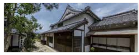
旧小田切家住宅 4月より平日休館、入館無料となります

問 旧小田切家住宅等の観光施設が土日以外休館となるが、平日は入館者がほとんどいないという状況なのか。 部長等 平日も入館者はあったが、より多くの入館者が見込める土日に注力するため。 問 イベント等への貸出は考えていないと伺ったが。 部長等 条例の制定や管理体制の整備も必要となるため、当面は自主事業のみ行いながら、