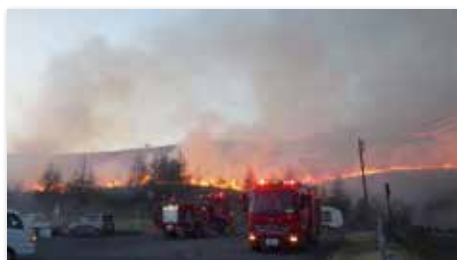
岩手県大船渡市の林野火災、鎮火まで1カ月、産業被害額100億円

問 須坂市が今後、財源が厳しい中で社会インフラ・経済インフラなどのインフラ整備をどのように進めるのか。 答 市民負担の少ない施設として有効活用しながら施設の更新、また、経済インフラの道路、橋りょう、上下水道などは計画的な維持管理と更新により、市民生活の基盤を確実に守っていく。 問 須坂市公共施設等総合管理計画改定案に