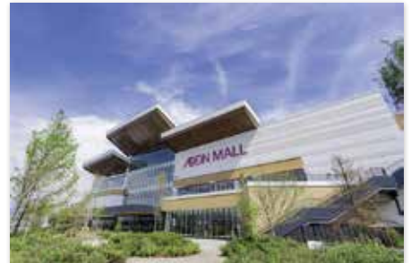
若い世代が多く転入し、人口増につながっているのでは…

問 産業の創出はできるのか。 市長 市の地域資源を活用した異業種の連携による新製品開発やAI・IoTの活用、カーボンニュートラルやGX分野の研究など産業間の連携を通じた人的ネットワークの構築などを行っている。 問 公共施設でリースの多い施設はあるのか。