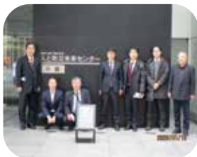
人と防災未来センターにて

人と防災未来センターは、阪神・淡路大震災の経験と教訓を次世代に伝え、防災・減災の知識を学ぶ防災学習施設。西館（震災の記憶・教訓）と東館（防災・減災の知識）で構成され、震災のさまざまな教訓を体験的に学んだ。