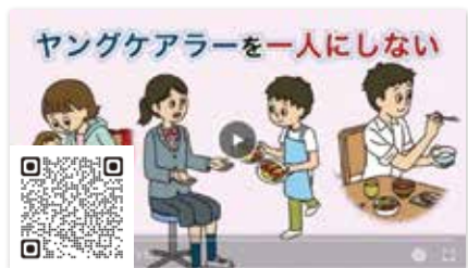
ヤングケアラーを支える取組

問 不登校で家族の世話を日常的に担っているヤングケアラーの疑いがあるケースは、何件把握しているのか。 部長等 7件でうち1件は不登校の状態が確認されているが、把握した全ての家庭に対して関わりを持って、支援している。 問 市が把握した7件は、氷山の一角に過ぎないのではないか。全生徒を対象とした実態調査を早急を実施すべ