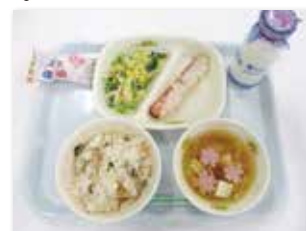
須坂市学校給食 ひなまつり献立