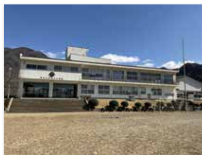
複式学級が行われている豊丘小学校

問 当市における複式学級の基準は。 教育長 県の基準（2学年合わせて8人以下）を適用している。 問 そのデメリットは。 教育長 児童側では、教育活動の幅が制限されることだ。 問 解消策はあるのか。 教育長 須坂学園構想を推進していくことだ。 問 学園構想は6、7年先のことで、在校生は卒業してしまう。 教育長 現況通り補助員を配置して対応する。