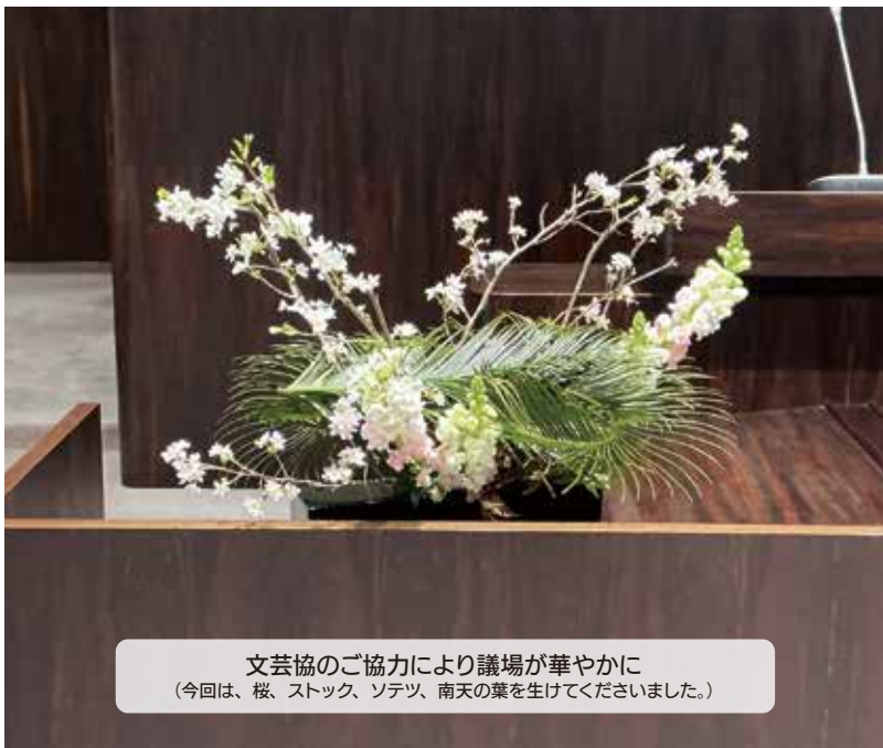
文芸協のご協力により議場が華やかに (今回は、桜、ストック、ソテツ、南天の葉を生けてくださいました。)

代表質問は、会派として施政方針や市長の行財政運営の基本姿勢や政治姿勢を問うものです。一般質問は、議員が市の行政事務全般の執行状況や将来の方針等について政策提案を含めて質問し、市長や教育委員会などの見解を求めるものです。質問事項は事前に通告され、質問時間は一人30分以内（答弁は含まず）です。