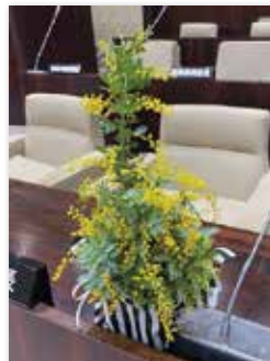
感謝を込めて「ミモザ」の花を贈りましょう

問 3月8日は国際女性デーです。別名は「ミモザの日」。市でもこの日に合わせて広報・啓発活動や講演会などを開催してはどうか。須坂市の「ミモザの日」をお互いに感謝し、認め合う日として広めてはどうか。それが社会全体の意識改革に繋がれば良いのでは。