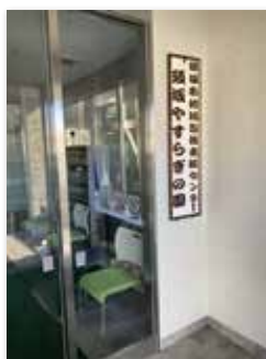
やすらぎの園そよ風2階

部長等 周知向上策として、後期高齢者の一人暮らしや、高齢者世帯の実態把握訪問を実施し、センターの支援内容を良く知って頂くように努める。