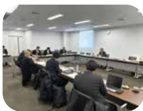
洲本市視察の様子

須坂市議会においても、行政側の報告を待たず、特別委員会の活用等を含め、再発防止策の進捗を行政とは独立した視点で厳しく監視し続ける姿勢が不可欠である。