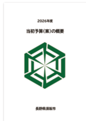
約 69 億 5 千万円の大幅減となった予算案

問 財政健全化の未来として、今回の削減で財政構造は本当に改善されたのか。 市長 歳出削減目標は達成したが、財政調整基金を繰り入れて収支均衡を図っており、硬直的な構造が直ちに解消したわけではない。将来投資へ向けた体力回復はまだ途上である。