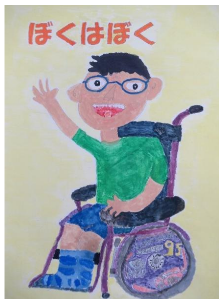
ポスターの部 小学校5年