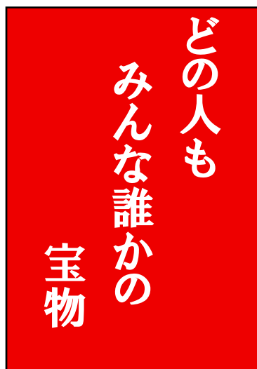
高校・一般の部 (株) 広田製作所