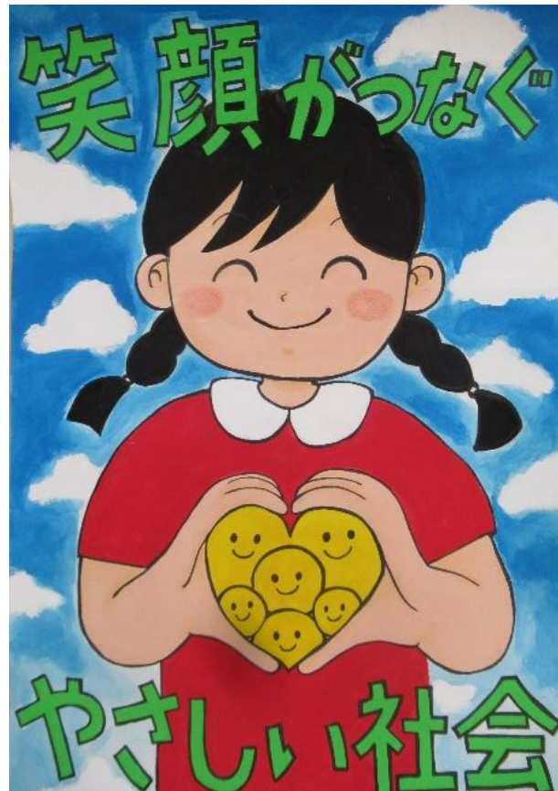
人権啓発ポスターの部 優秀作品