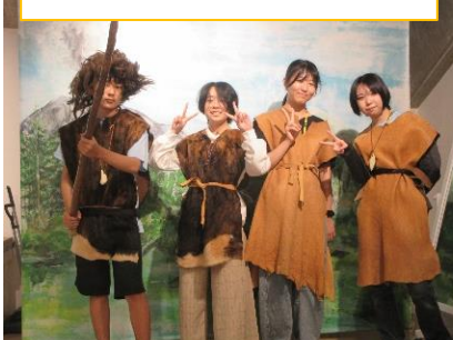
野尻湖ナウマンゾウ博物館