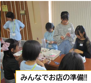
みんなでお店の準備!!