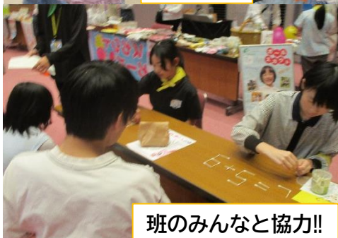
班のみんなと協力!!