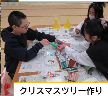
クリスマスツリー作り

第4回 ふれあい広場で活躍せよ! 第5回 竜の里ウォークラリー 第6回 FINALSTAGE