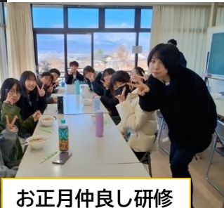
お正月仲良し研修