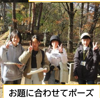
お題に合わせてポーズ