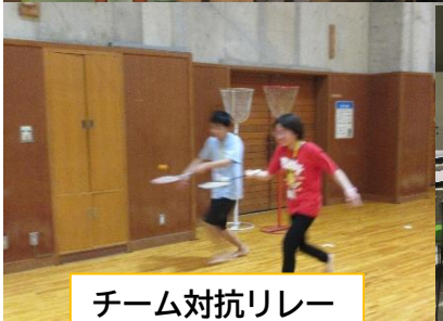
チーム対抗リレー