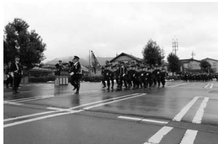
▲須坂市消防出初式（1月11日）