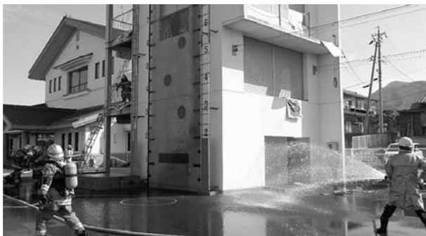
▲火災防ぎょ訓練（3月1日） 実践に近い訓練を署と合同で行いました 担当 第6分団