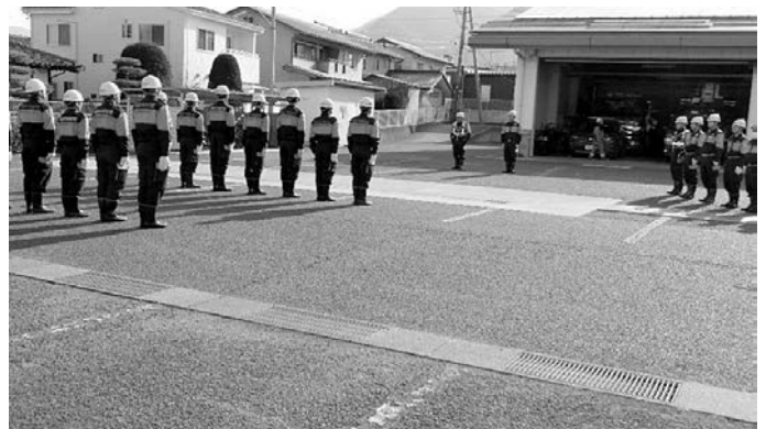
▲通常点検（3月1日） 第3分団・第4分団