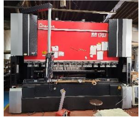
ベンダー170t HG 1703