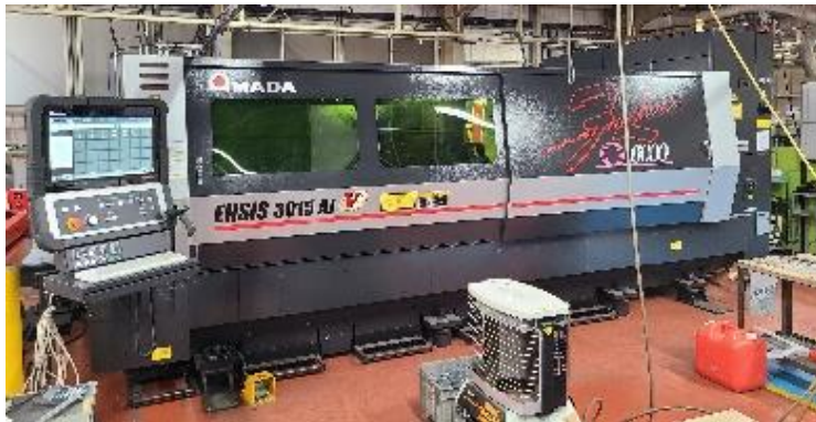
ファイバーレーザー加工機 ENSIS 3015 AJ 6kw