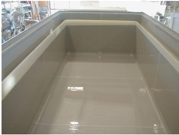
↑ PVDF内面ハイブリッドタンク