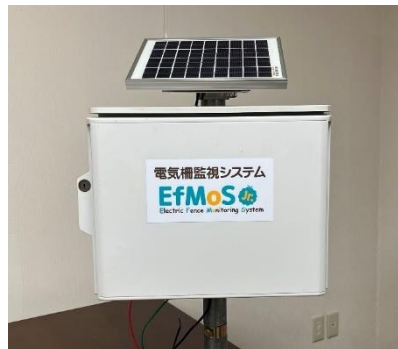
「電気柵監視システム エフモスジュニア」