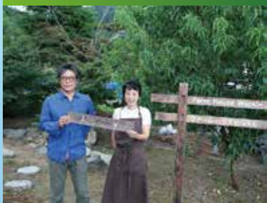
農家民泊 小布施素泊まりの宿 KOKORO TEL 090-8843-9091