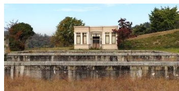
【市民の生活を支えた旧坂田浄水場遺構】