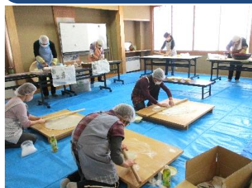
【一連のそば打ちの行程を役割分担で】