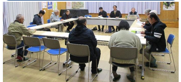
【分館役員の皆様、一年間お疲れ様でした】

分館連絡協議会の一年間の活動を総括し、事業・決算報告が承認されました。今後の課題として、スポーツ大会のあり方(開催時期・種目)、人権問題学習会の回数(各分館・ブロック)等の意見が出ました。