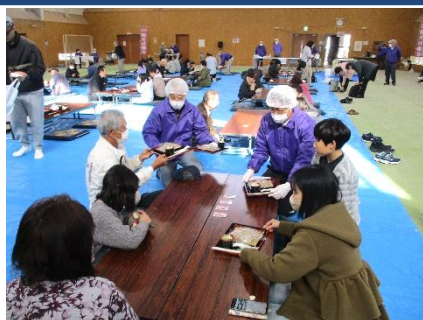
【「お待ちどう様でした。新そばをご賞味下さい」】