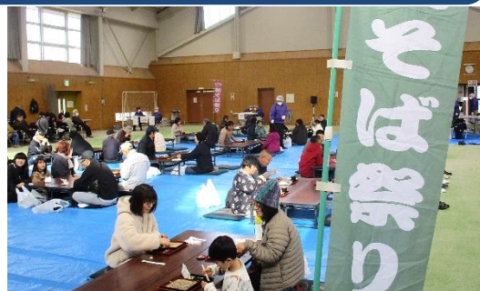
【新そばのお味は、いかがだったでしょうか？】