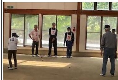
写真は昨年の大会