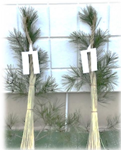
中島町 富澤 正様から 寄贈していただきました