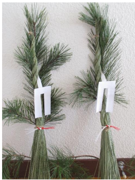
中島町 富澤 正様から 寄贈していただきました