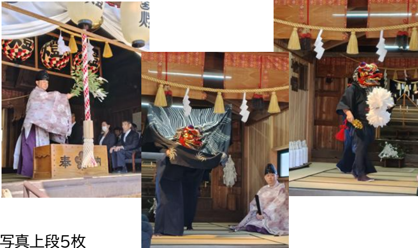
写真上段5枚 相杜神社祈年祭の様子

健御名方神社では、春の陽気が感じられる4月14日を祭日として定めて祈願を行っています。