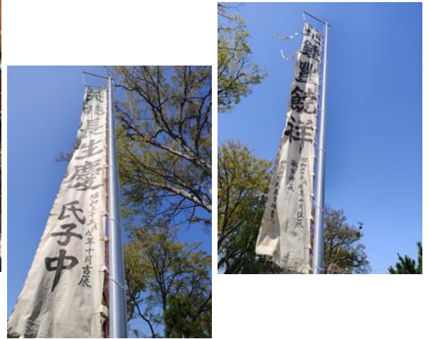
写真下段4枚 健御名方神社祈年祭の様子