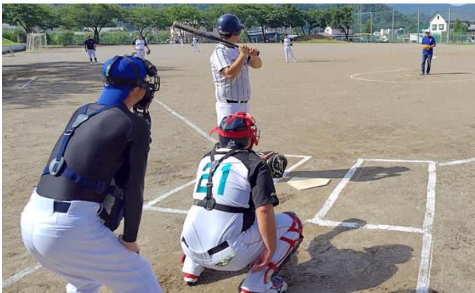
2024年度 第5ブロック公民分館対抗球技大会 対戦表

優勝の本郷町は8月18日(日)第53回須坂市ソフトボール大会に第5ブロック代表として参加します。この大会のように猛打爆発で圧勝してください。ご健闘を祈念申し上げます。