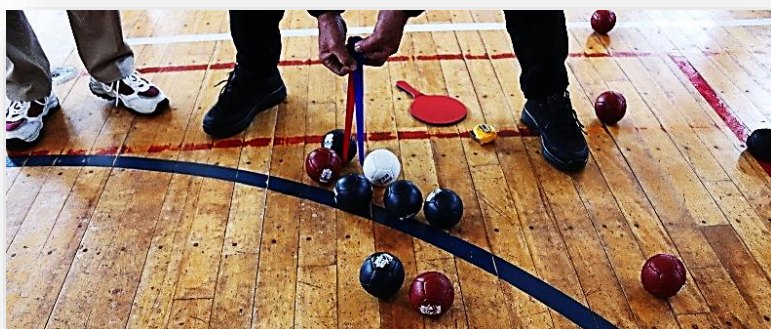
B コートでのこの日一番の試合

小学生を含む親子の参加もあり、年齢を気にせず誰でもできるボッチャを楽しみました。