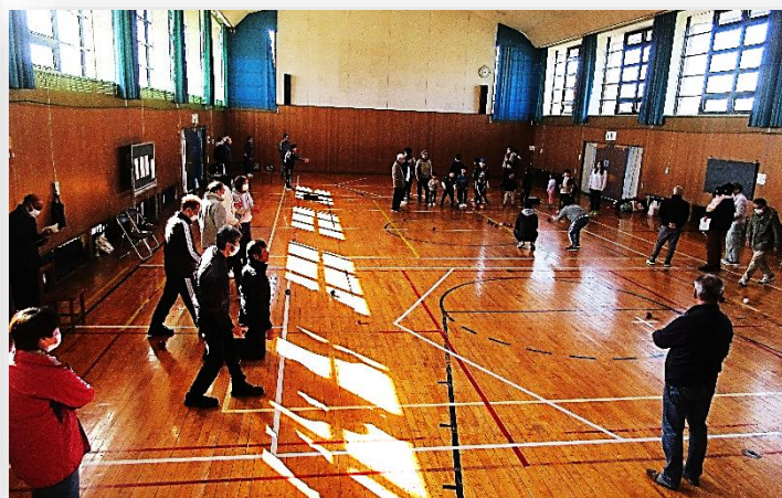
暖かい日差しが入る多目的ホール