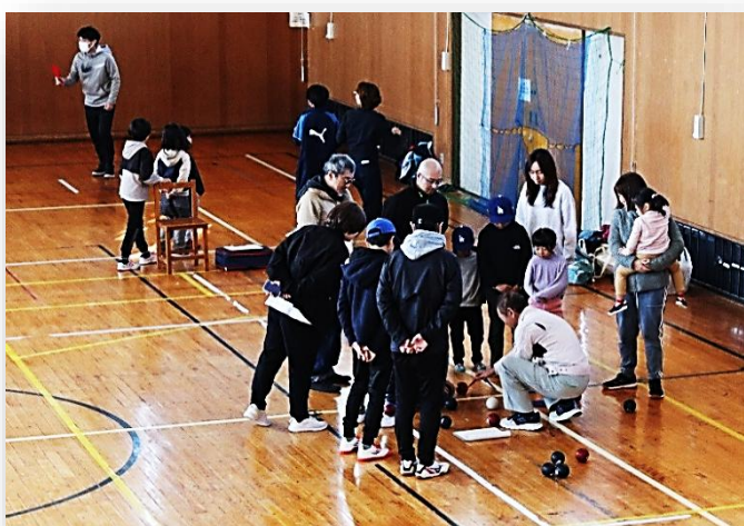
試合後、みんなで確認