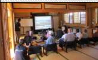
社会福祉協議会によるボランティア活動報告会

ロープワークを学んだり、身近な物を使ったタープ張り、キャンプ道具を災害時に使えるように。