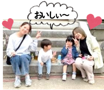
おいしいものを食べながら一休み