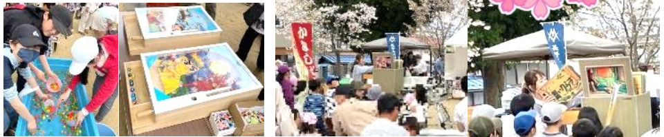
子どもたちはスーパーボールすくいでも大盛り上がり 【紙芝居】