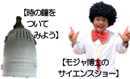
【時の鐘をついてみよう】