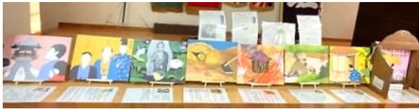
紙芝居「六角堂観音堂のおはなし」→

馬場町の春の例大祭。夕方6時前に伺いましたが、分館職員による駄菓子販売は完売!!わたあめ・ポップコーン・おでんも残り僅か…。一足も二足も遅かった。でも、お目当ての手作り燈籠の点火は無事見学できました。今年は区民趣味の作品展会場に六角堂観音堂のおはなしの紙芝居も展示されていました。