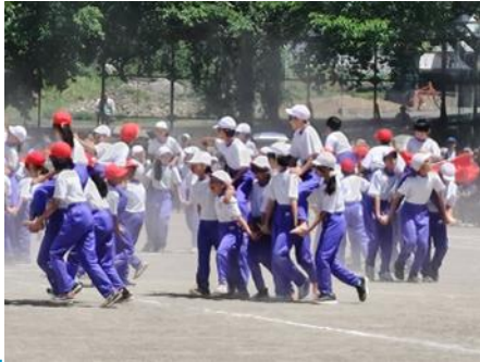
写真上 : 1・2年生による「やってみよう・玉入れ!」