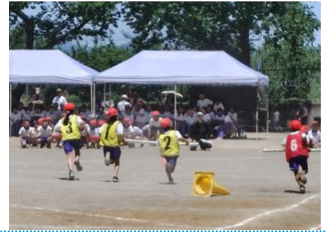
写真右 : 3・4年生による「力を合わせて! 協力タイフーン」