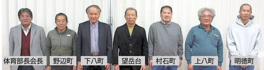
体育部長会長 野辺町 下八町 望岳台 村石町 上八町 明德町

1月8日(木)、本年度第一回正副分館長・体育部長会長会議を開催。第一回ブロック運営委員会に諮る令和8年事業計画、予算の立案審議を行いました。