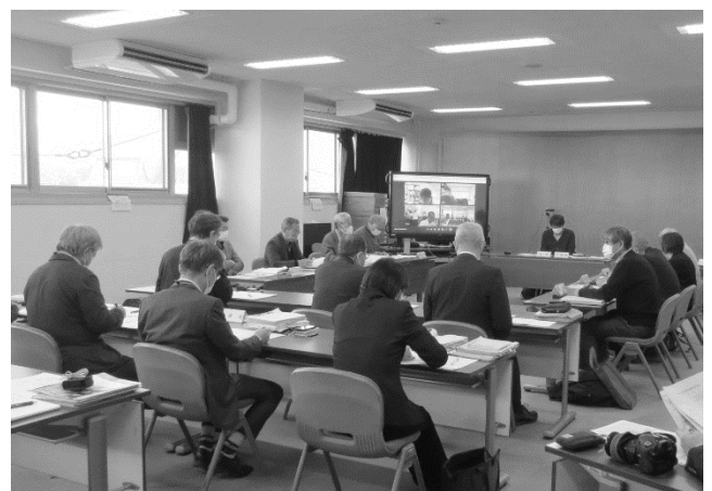
第2回須坂市伝統的建造物群保存地区保存審議会

伝建地区の予定範囲内にお住まい、または土地を所有されている皆さまへは、今後改めて制度の説明会を開催してまいりますので、ぜひご出席いただき、ご意見等賜りますようお願いいたします。