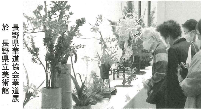
長野県華道協会華道展 於 長野県立美術館