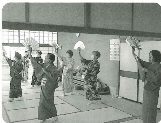
初めての日本舞踊 (花柳葉緑社中)