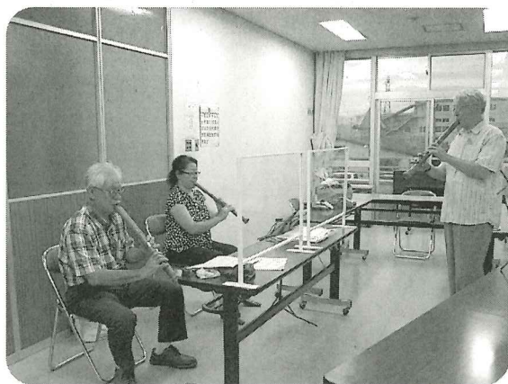
尺八令和2021 (尺八汎山会)