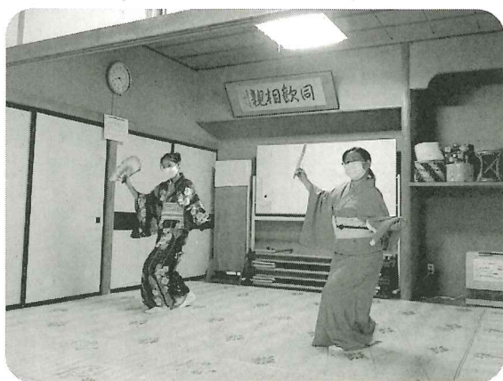
気軽に楽しむ日本舞踊 (藤勢津会)