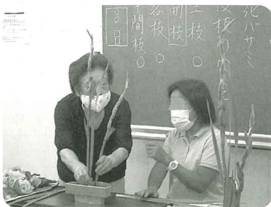
楽しい いけ花 (小原流)