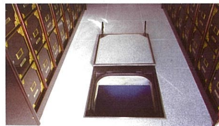
合同納骨室(1,500体分予定)