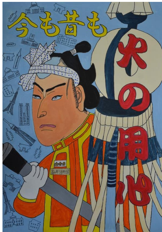
第 18 回防火ポスターコンクール最優秀賞作品