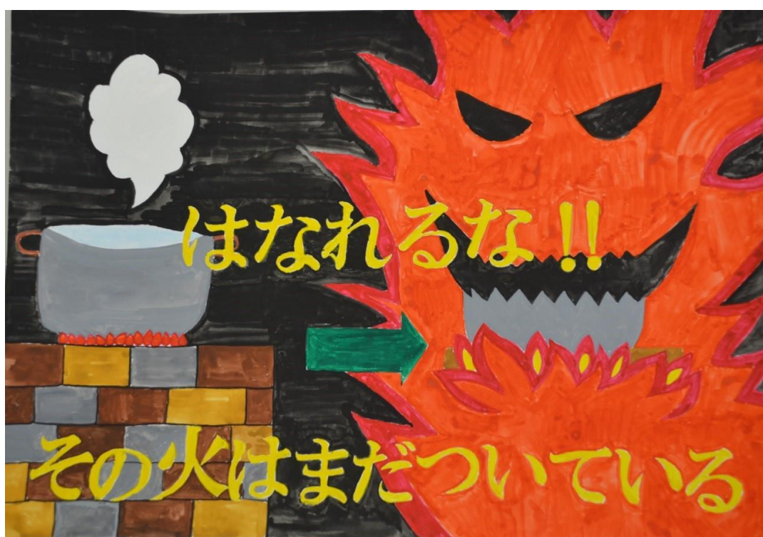
第 17 回防火ポスターコンクール最優秀賞作品