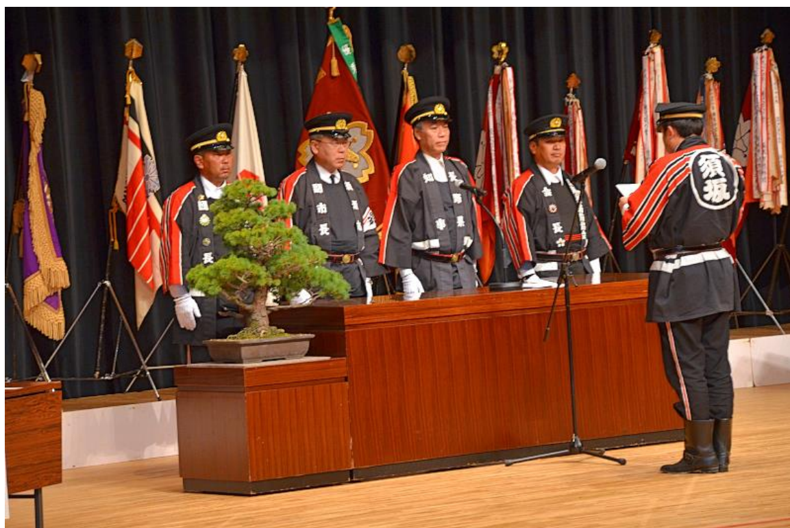
令和2年須坂市消防出初式