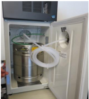
冷蔵機能付 ビールサーバー