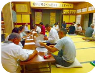
大日向町 10月10日 幼児・児童虐待