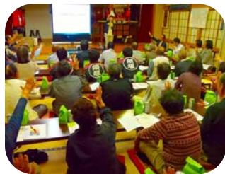
豊丘町 10月3日 認知症を正しく知ろう