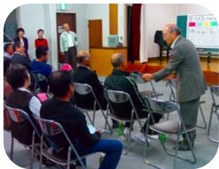
豊丘上町 10月24日 みんなが暮らしやすい町へ