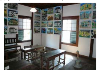
復元された教室(2階)

明治～昭和時代に使われた教科書・教材や、豊丘小学校卒業生の絵が(毎年更新)展示されています。