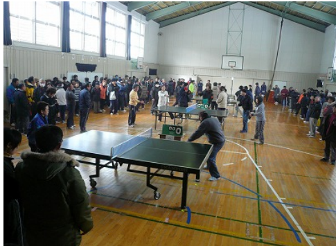
大会の様子(豊丘小体育館)

2月13日、恒例の組別対抗団体戦(14チーム)が盛大に行われました。各組10人の選手により熱戦が繰り広げられた結果、豊丘町1組が昨年に引き続き優勝しました。今年も参加者が200名を越え、卓球を通して地域のつながりがより深まった素晴らしい大会となりました。