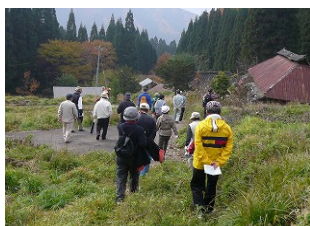
寺久保集落跡を散策