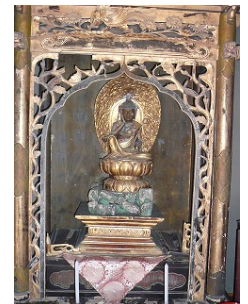
如意輪観音 (但唱上人の作)