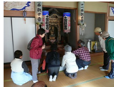
現在の観音堂(上原の旧公会堂)

奈良川は地域の仲間で作る「かじかクラブ」に見守られています。「かじかクラブ」は年1回上流を見回って、粗大ゴミ等を拾って以前のようにイワナやカジカ・イモリ・沢ガニなどが住める自然の川に生き返らせる運動をしています。