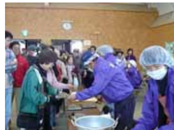
大忙しの手打ちそば引換え

11月23日、「そのさとホール」で恒例の新そば祭りが行われました。天候にも恵まれ、11時の開始前より大勢の皆さんが並び、手打ちそば限定400食が1時間で売り切れてしまい、更に50食を追加して、来ていただいた方全員に味わって貰いました。予想以上の大勢のお客さんの対応におおわらわだった豊丘地域づくり推進委員会の皆さんにとって「そばが大変おいしかったので待ったかいがあった」と帰り際のお客さんの言葉が何よりでした。