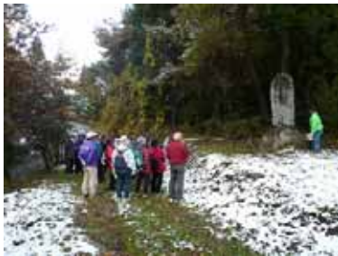
三原道の道標を兼ねた牛の守護神大日如来碑にて、「右上州みはら道 左やまみち」と刻まれている

前日、例年より早い初雪で天候が心配されましたが、当日は朝から晴れて、うっすら雪化粧した奈良山と紅葉のコントラストが素晴らしく豊丘の歴史と自然の良さを新たに知ることができました。