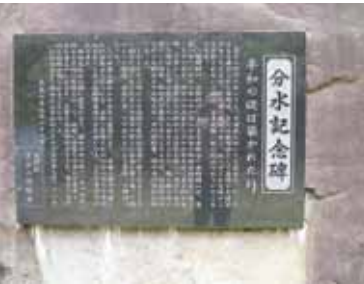
分水記念碑「平和の礎は築かれたり」と刻まれています