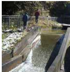
塩野側と水争いの元となった分水口、2分8分に分水されている