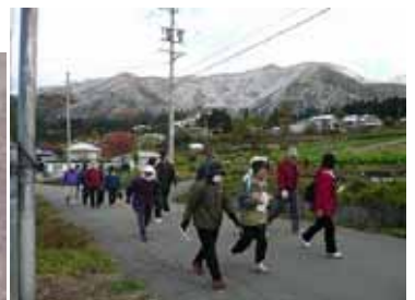
約6キロメートル歩きました