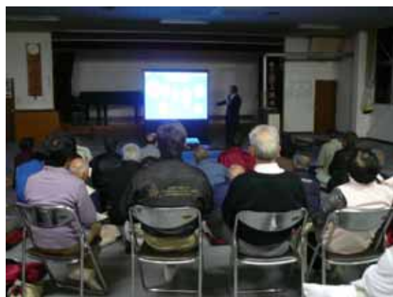
地域の気象災害や地球温暖化に関心が高かった参加者

現在、国民1人あたりが排出する二酸化炭素(CO2)量は、1日平均で約6kgです。私たちにできることから温暖化防止の取組を実践しましょう！