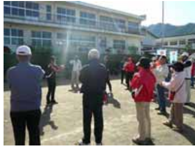
インストラクターより健康に良い歩き方の指導を受ける参加者

さわやかな秋晴れの下、豊丘地区ふれあい祭りが盛大に開催されました。カルチャーウォーク、ニュースポーツ、ミニマラソン、消防11分団のラップ吹奏、豊丘小学校鼓笛隊、ビンゴゲームなど大人も子ども一緒になって楽しいふれあい祭りとなりました。