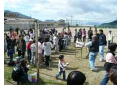
ビンゴゲームに集まった参加者