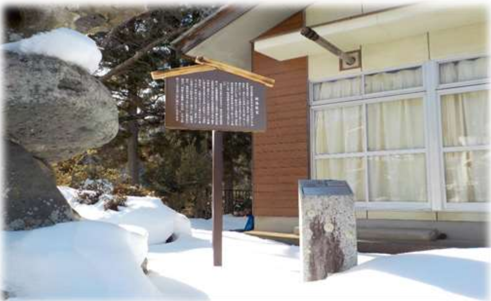
西原公会堂（阿弥陀堂）