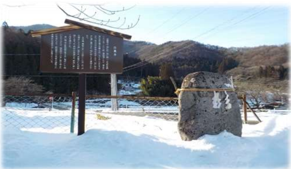
新田公会堂（白鳳寺）

毎年仁礼地域づくり推進委員会で、仁礼地域の歴史を感じる場所や石碑についての説明板を設置しています。今年度は仁礼町の新田公会堂（白鳳寺）・西原公会堂（阿弥陀堂）・丸山薬師堂の三ヶ所に設置しました。それぞれ身近な公会堂や、お堂にまつわる歴史について書かれています。近くにお寄りの際はちょっと足を止めてご覧ください。