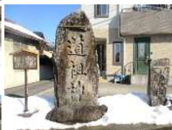
米持町 道祖神・庚申塔