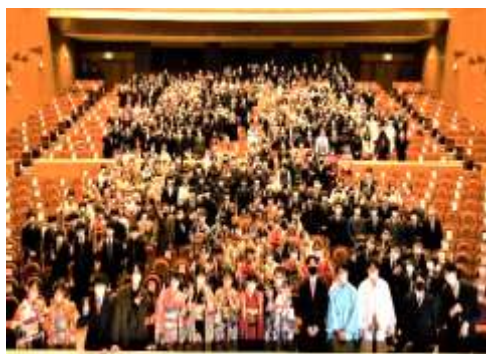
式典最後に記念写真をパチリ

1月9日(日)2年ぶりにメセナホールで成人式が行われました。 コロナ禍ではありましたが、新成人のみの参加・マスクの着用・手指消毒など感染対策を講じ、新成人の門出を祝福することができました。