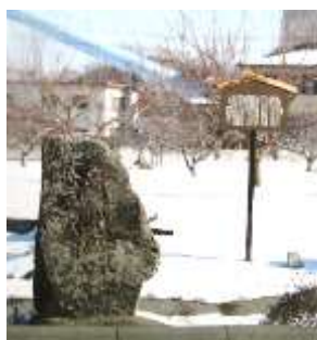
井上町 道標 (大笹街道と作場道)