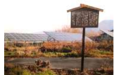
川除大明神 （大神宮）