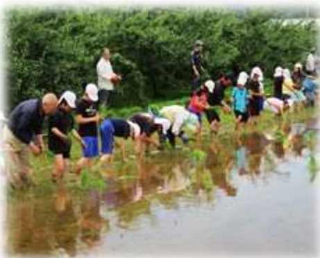
おいしいおいしいお米になあれ！！！！

水を張った田んぼに入る前はみんな不安そうな顔、そして植え始めはおそるおそるの手つきでした。ですが、地域づくり推進委員会・「ふれあい教室」の皆さんに教えていただきながら、やり始めるとあっという間に慣れ、上手な手つきで植えるようになりました。植える姿も初めてとは思えないほど、さまになっていました。