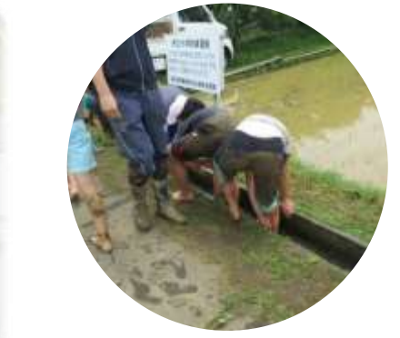
転んで泥だらけになった子ども