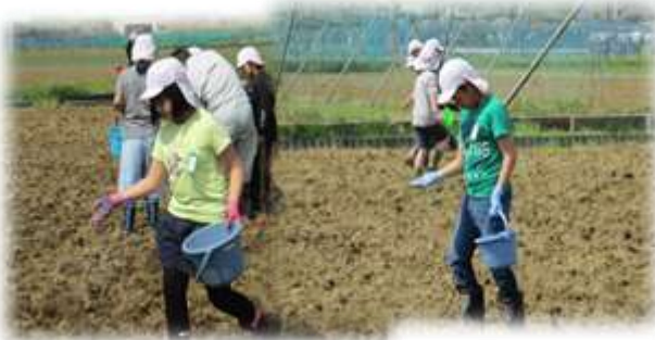
肥料もみんなで撒きました（5月1日）

自分たちでの肥料撒きや、田起こしと代かき見学をして、田植えをするまでの大変さを感じていた子どもたち。いよいよその田植えをしました。