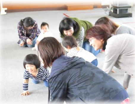
1歳未満の赤ちゃんもいますよ。