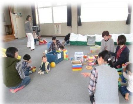
4月の様子です。お母さんと一緒に楽しそうです。