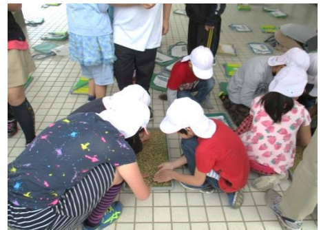
1箱に170gのお米を蒔きました