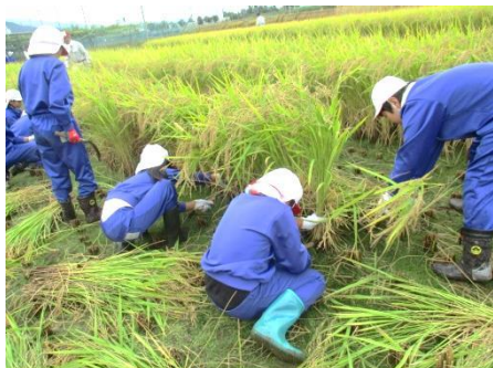
とても上手に刈りました