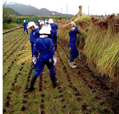
きれいにハゼ掛けが出来ました

稲刈りの後、雨・雨・曇り、そして台風と天候不順により20日の脱穀の予定を延期して27日に行いました。