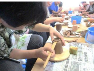
湯呑みに高台を付けています