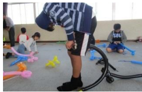
風船を結ぶのも大変

10月20日市営屋内ゲートボール場で、井上町、福島町、米持町は各2チーム、幸高町、中島町の8チームの参加で行いました。優勝チームが市老連大会へブロック代表として出