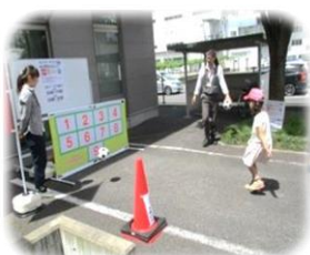
ボール蹴りのゲームで景品もらいました