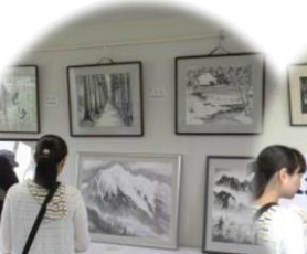
桐里墨心会（水墨画）