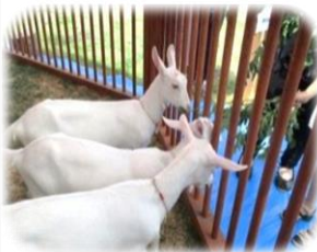
緑地公園ではヤギさんとふれ合い

須坂市技術情報センター周辺一帯で情報フェスタが開催されました。井上地域公民館からは教室で作成した作品を展示しました。