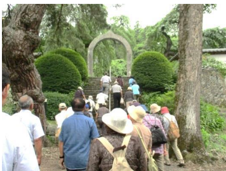
真田家の菩提寺 長谷寺の石門に向かって

その他、真田氏館跡・本城跡、そして真田家の菩提寺である長谷寺や信綱夫妻・昌輝のお墓のある信綱寺では墓前に真田家の家紋である六文銭にちなんで5円玉を6ヶ並べ、手を合わせて冥福を祈りました。