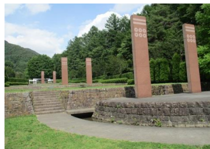
古城緑地広場 歴史の丘