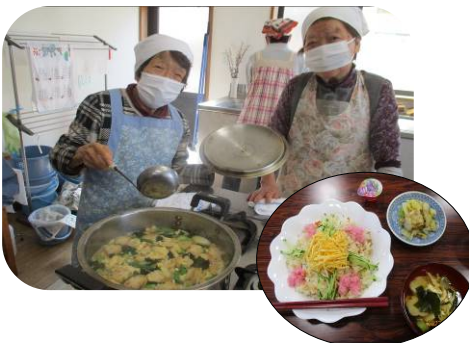
健康講話を学んでから皆でちらし寿司を作りました♪