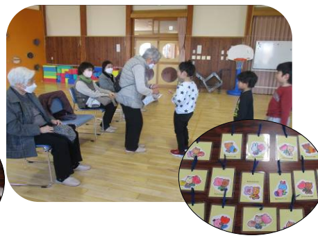
少人数で久しぶりに保育園の中で交流♪ 卒園祝いの葉を手渡しできました。