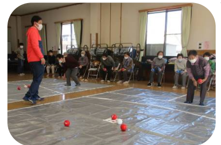
パラスポーツ「ポッチャ」腕が上がってきています♪

すこやかふれあい広場は須坂市にお住まいの65歳以上の方が対象の介護予防教室です。ただ今新会員絶賛募集中！！ 気になる方はご見学もどうぞ♡