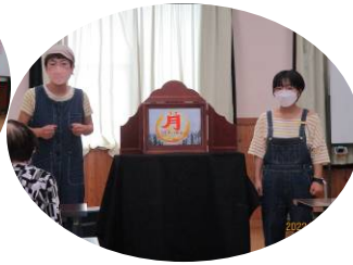
うたおうプラザさんと交流