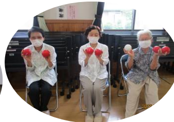
パラスポーツポッチャ