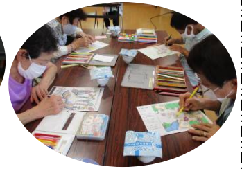
好みのデザイン画でぬり絵

すこやかふれあい広場は、週2回（火曜・水曜） 保健師による血圧測定と健康相談のほか、様々なプログラムを通して「達者で長生き」を目指す市の事業 です。送迎はありませんが、お元気なうちに入会されるほどメリットがいっぱいです！