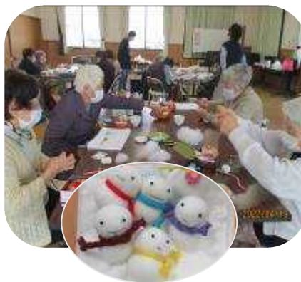
雪だるまのストラップと 手縫いの雑巾作り