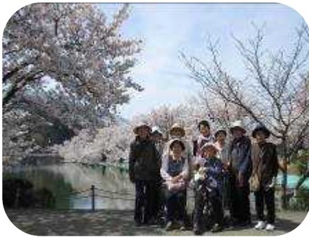
臥竜公園でお花見 運よく ちょうど桜が満開でした